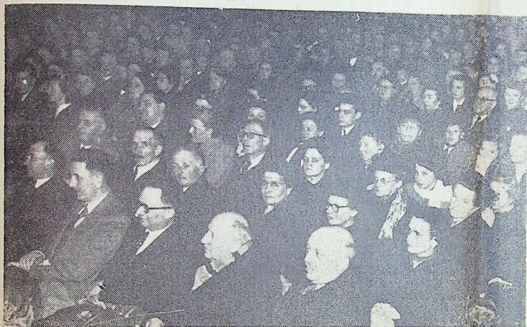
Une partie de l'assistance lors de la représentation