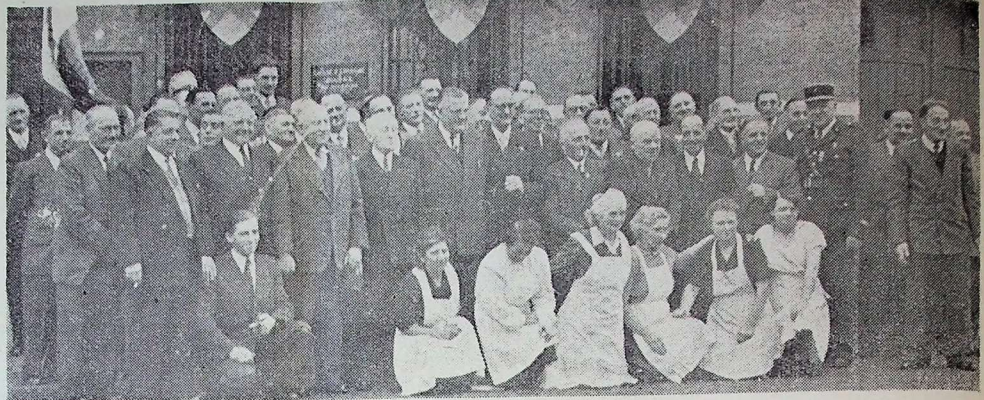
Toujours fidèle à une tradition déjà vieille, les Anciens combattants de 1914-1918 unis à ceux de la dernière guerre ont joyeusement célébré l'anniversaire de l'Armistice. Les voici réunis avant traditionnel banquet qui ne manqua pas d'être « bien » servi et très animé.