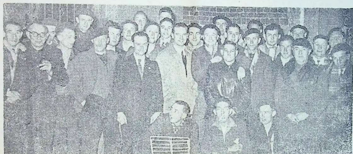
Notre cliché les représente à l'issue de la réunion