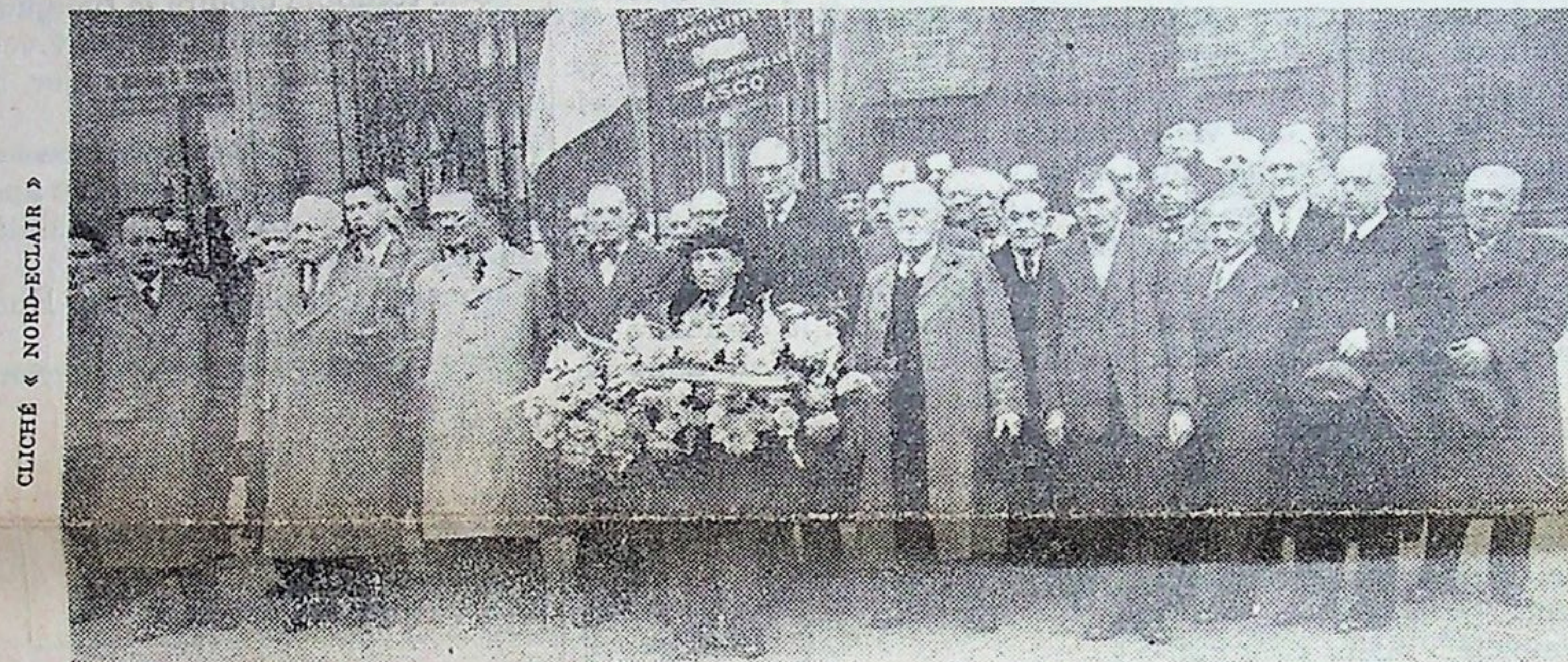
CLICHÉ « NORD-CLAIR »

Au fil des ans, et par suite du décès de l'un ou de l'autre membre, de profondes modifications furent apportées au sein du comité directeur en même temps que ce dernier fut élargi.