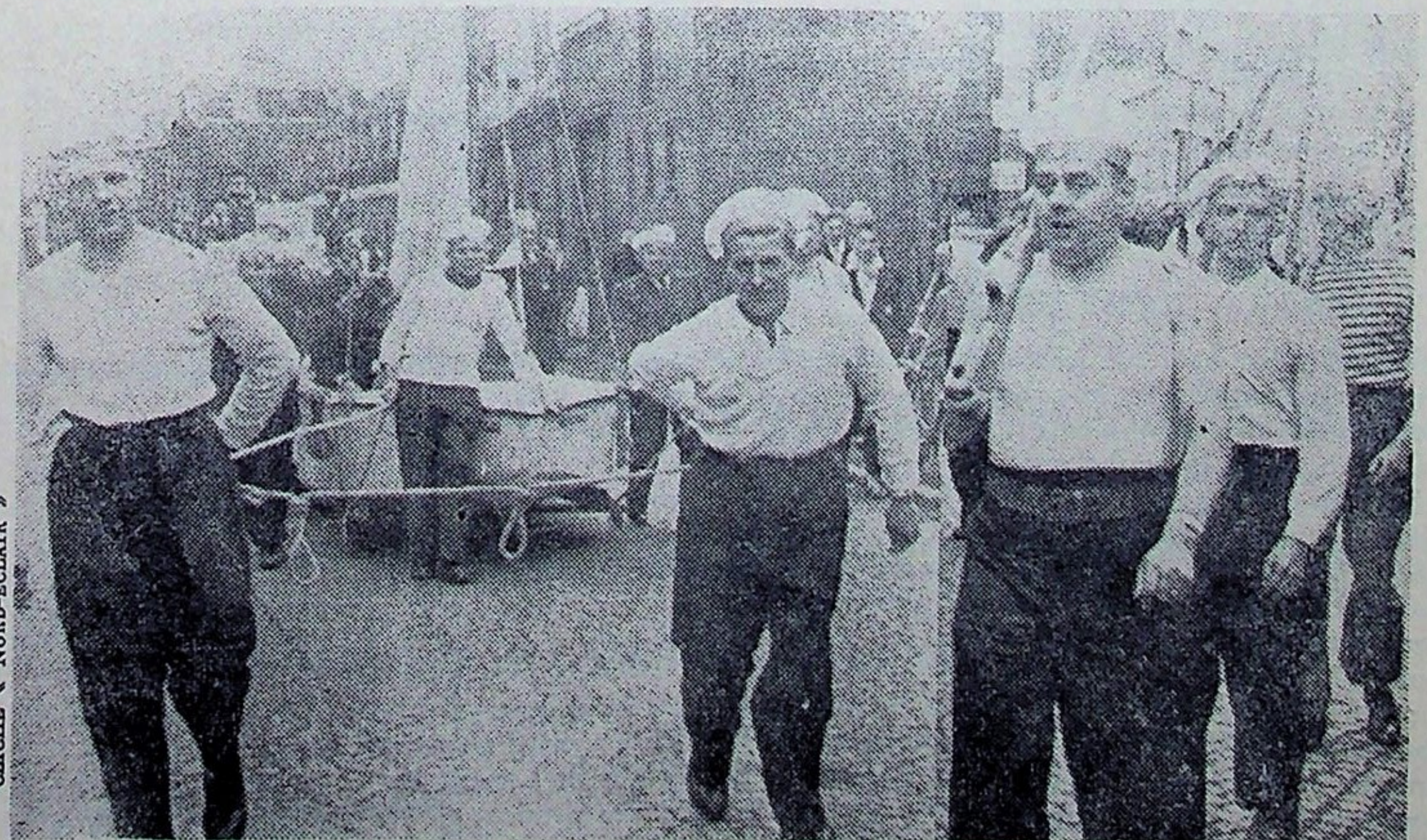
Les gars de la marine française sont des forts. Ils l'ont prouvé, non seulement en battant par 5 à 2 le lycée Papillon, mais aussi en tirant à la corde leur voilier le « Nénuphar » à travers les rues de la commune

localités alsaciennes, leur a donné une certaine nostalgie. Bien que l'itinéraire sera différent les jeunes peuvent être assurés de vivre de magnifiques vacances. Le départ aura lieu le 2 août et le retour a été fixé au 16 du même mois. Les jeunes travailleurs qui désirent participer au camp peuvent s'adresser à Paul Ultré ou à Denis Blanchatte.