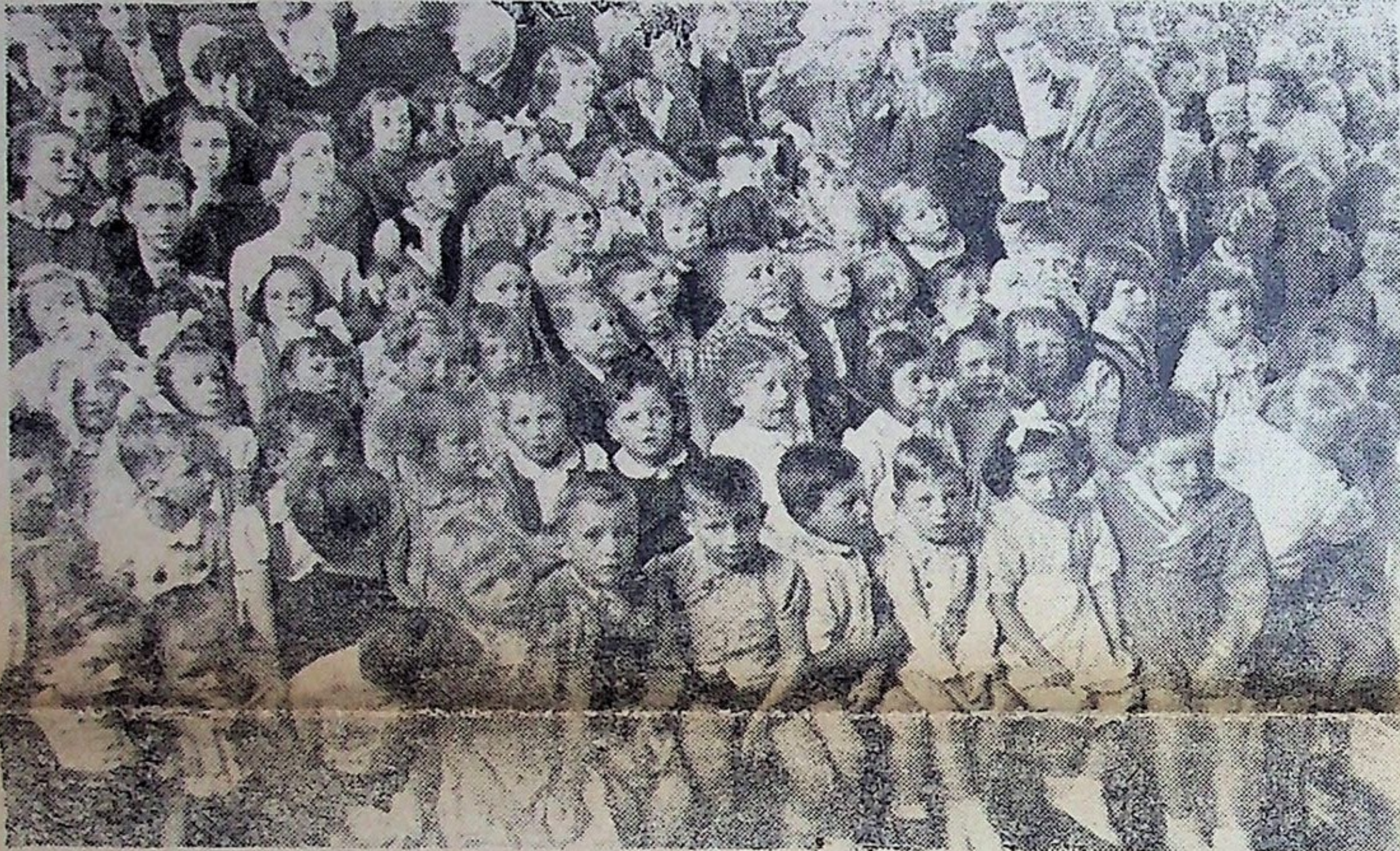
La fête des mères, c'est aussi celle des enfants. En grand nombre, dimanche, ils chantèrent pour leurs mamans avec la joie qu'on devine. - Sur notre cliché, une partie des enfants qui amusèrent l'assistance.