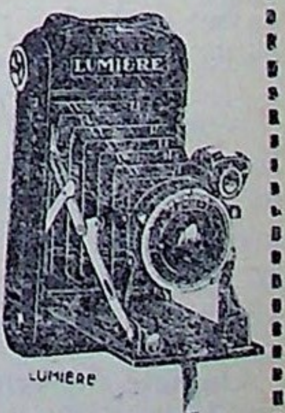
Photo Cinéma Optique