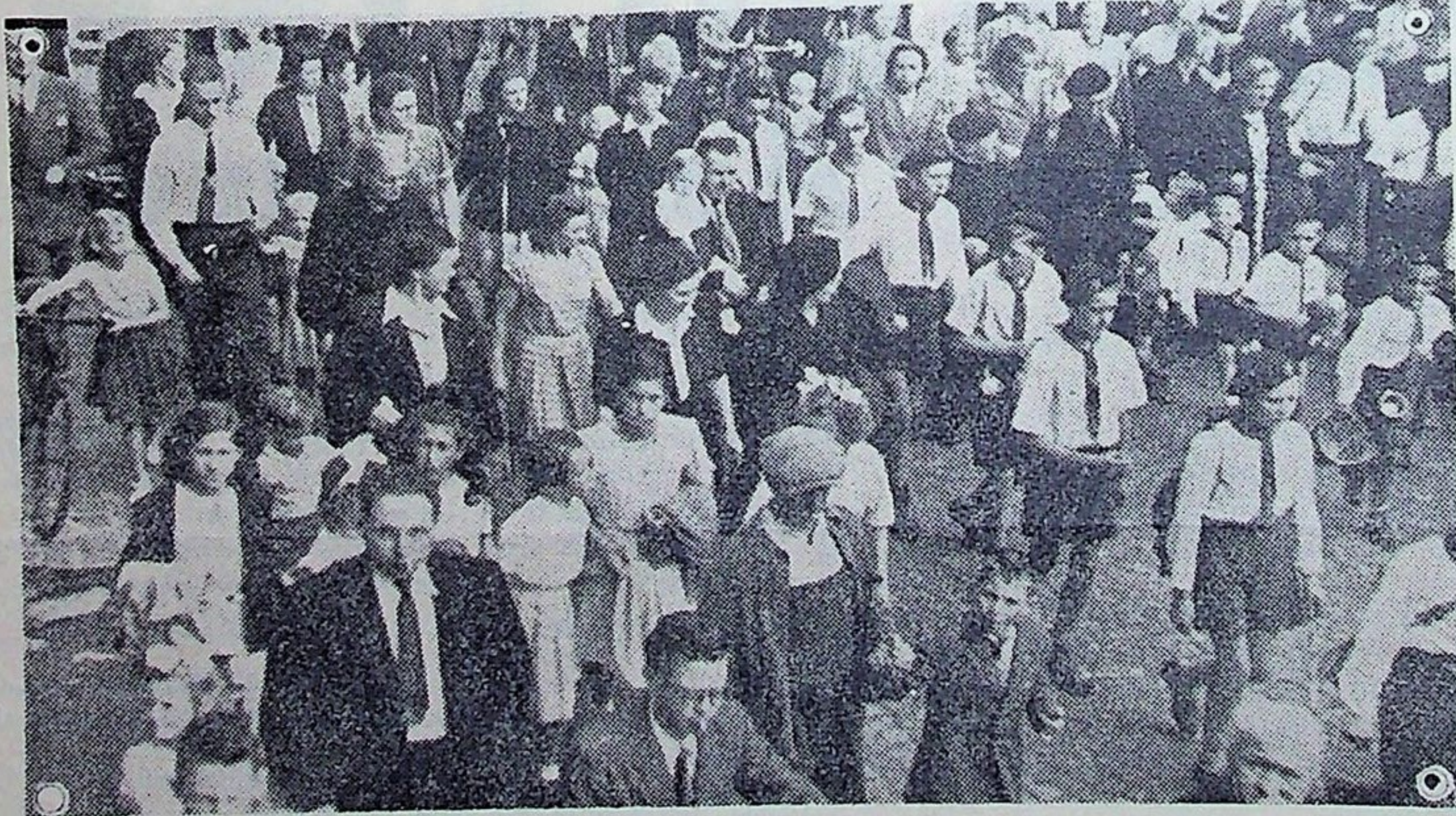
Les Cœurs Vaillants sont rentrés dimanche, dans leurs familles, après avoir passé un excellent séjour dans le Jura. Ainsi qu'en atteste notre cliché une foule nombreuse a accueilli les « C. V. » à leur arrivée dans la commune.