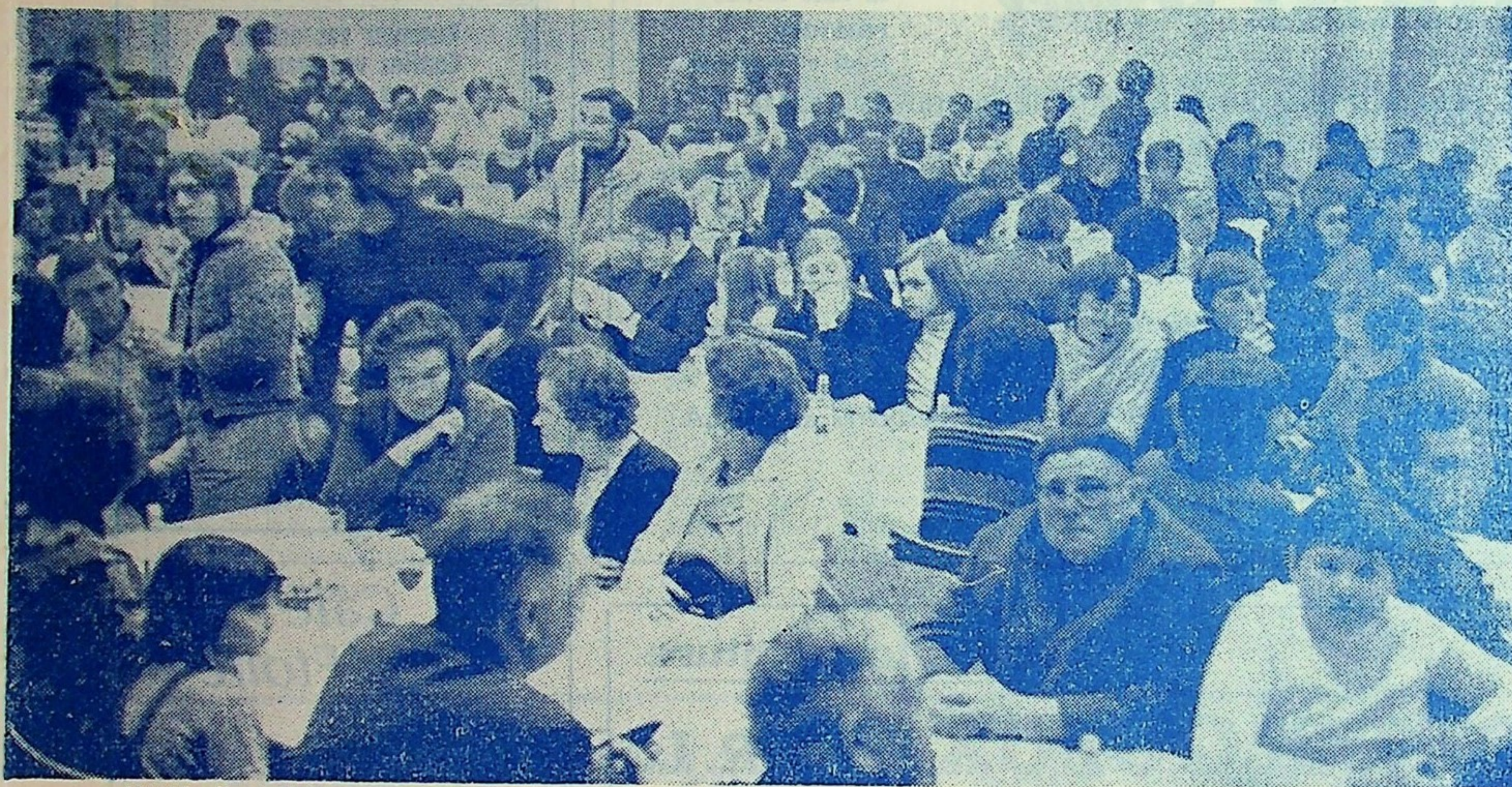
Cliché «Nord Eclair»

«Ce soir à l'Union Sportive Ascquoise» tel est le titre qui chaque année revient en mémoire des sportifs ascquois à pareille époque. Une fête de Noël originale qui est à l'image de l'esprit de ce club sympathique : une grande fête de famille.