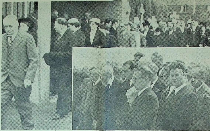
DEUX VUES PRISES DURANT LA CÉRÉMONIE AU CIMETIÈRE