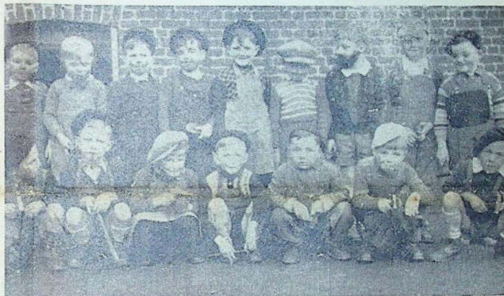
« Joyeux cordonniers »... ils le furent certes les charmants bambins de l'école maternelle. Avec cœur, ils « tapèrent » de leur marteau la semelle de leur chaussure, tout en chantant à gorge déployée, le refrain de leur entraînante tournée et ce pour le plaisir des spectateurs de la salle des œuvres