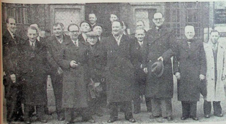
La réunion est terminée et les mutualistes quittent la mairie où ils viennent de tenir leur assemblée générale