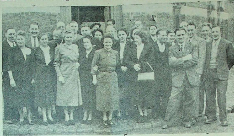
Les brideurs n'étaient pas les seuls à participer au banquet. Quelques épouses, se rappelant le succès de l'an dernier n'avaient pas voulu manquer une aussi agréable journée

Les brideurs d'Ascq dont le nombre ne cesse de s'accroître, ont tenu leur banquet annuel allé de l'Étoile.