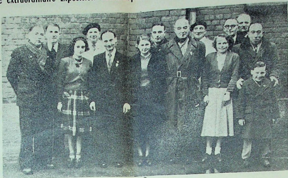
CLICHÉ « NORD-ECLAIR »

Une extraordinaire Exposition Colombophile s'est tenue, dimanche, Salle des Fêtes