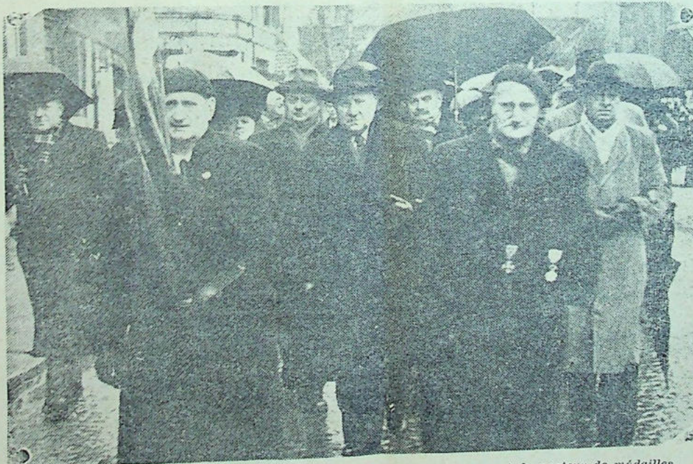
La Commission des Anciens Combattants précédée de son drapeau et du porteur de médailles

Selon la volonté du défunt de modestes funérailles lui furent faites.