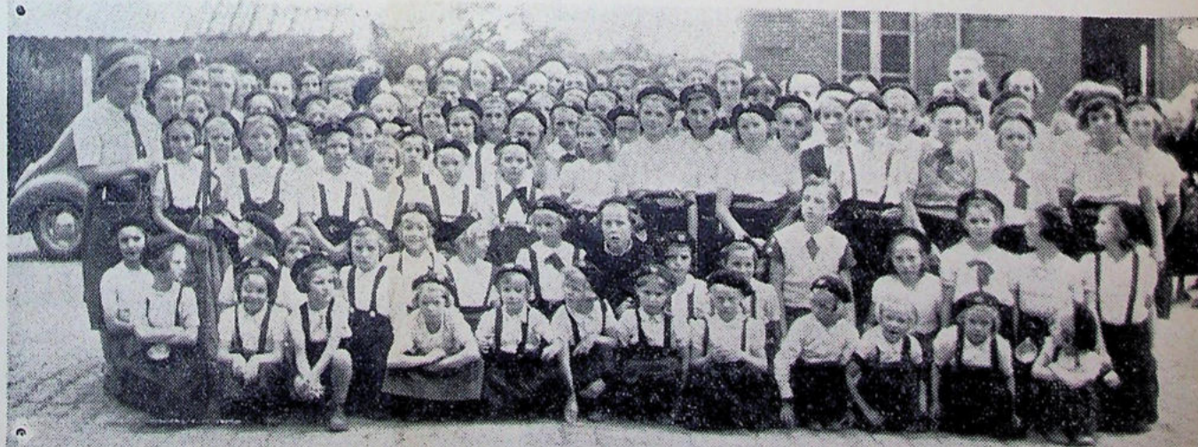
LES FILLETES RASSEMBLEES APRÈS LE CHANT DE L'« AU REVOIR »

Les uns sont partis, les autres (les « Ames Vaillantes ») sont rentrées après un mois de colonie dans ce coin charmant et pittoresque de Rivière-Devant dans le Jura.