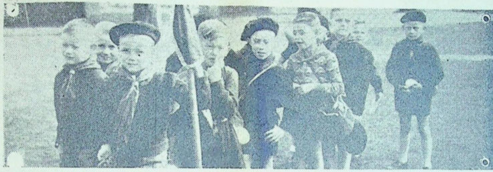
Les « Aiglons » comme les « Cœurs Vaillants » sont partis dans le Jura, et leur équipe avant le départ ne manque pas d'allure.