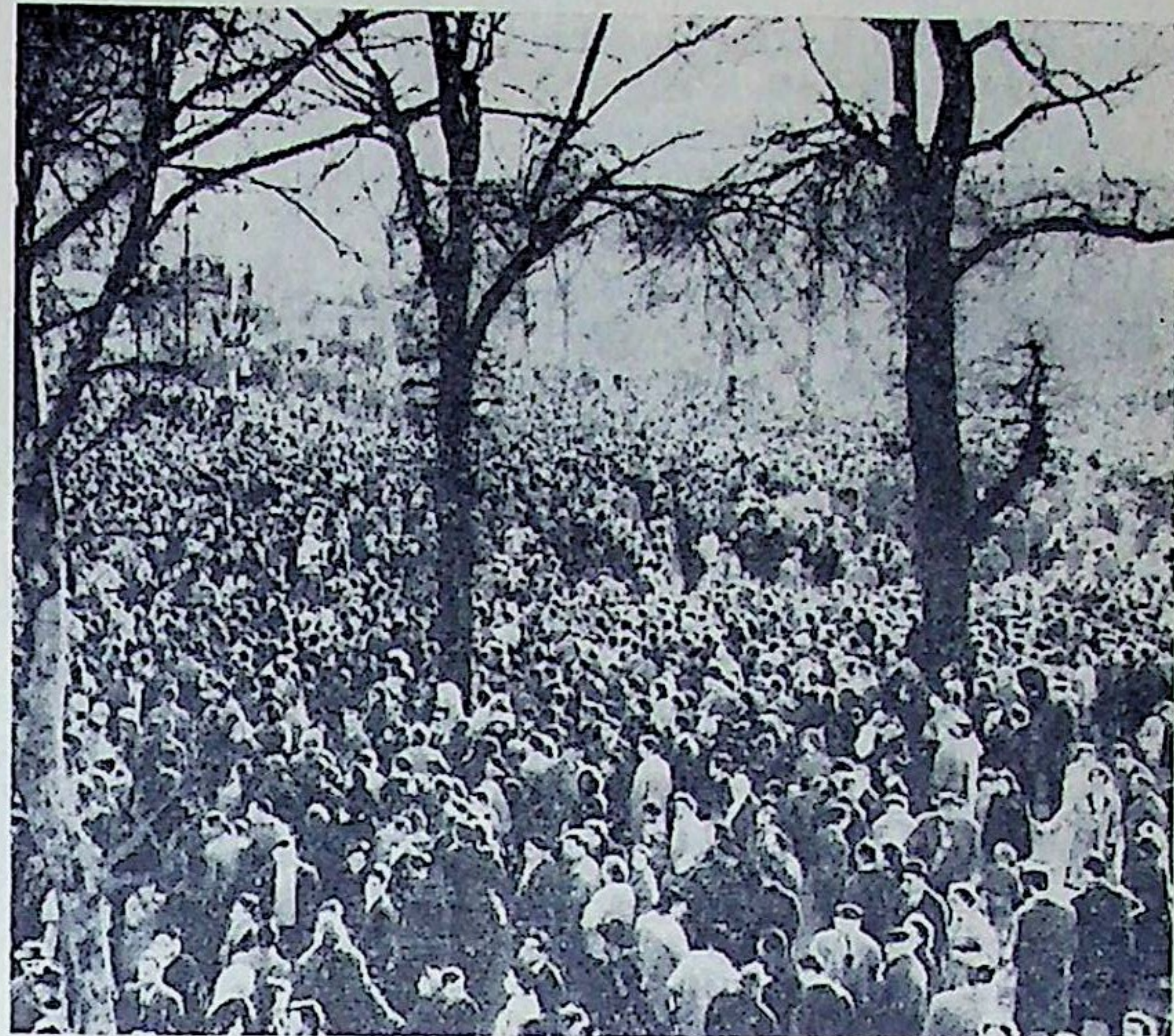
« Une foule innombrable de tous pays, de toutes races, de toutes langues. » (St JEAN.)

Dès qu'on entre dans l'église d'Ascq, on admire ce bel appareillage de pierres, ces colonnes trapues dont la