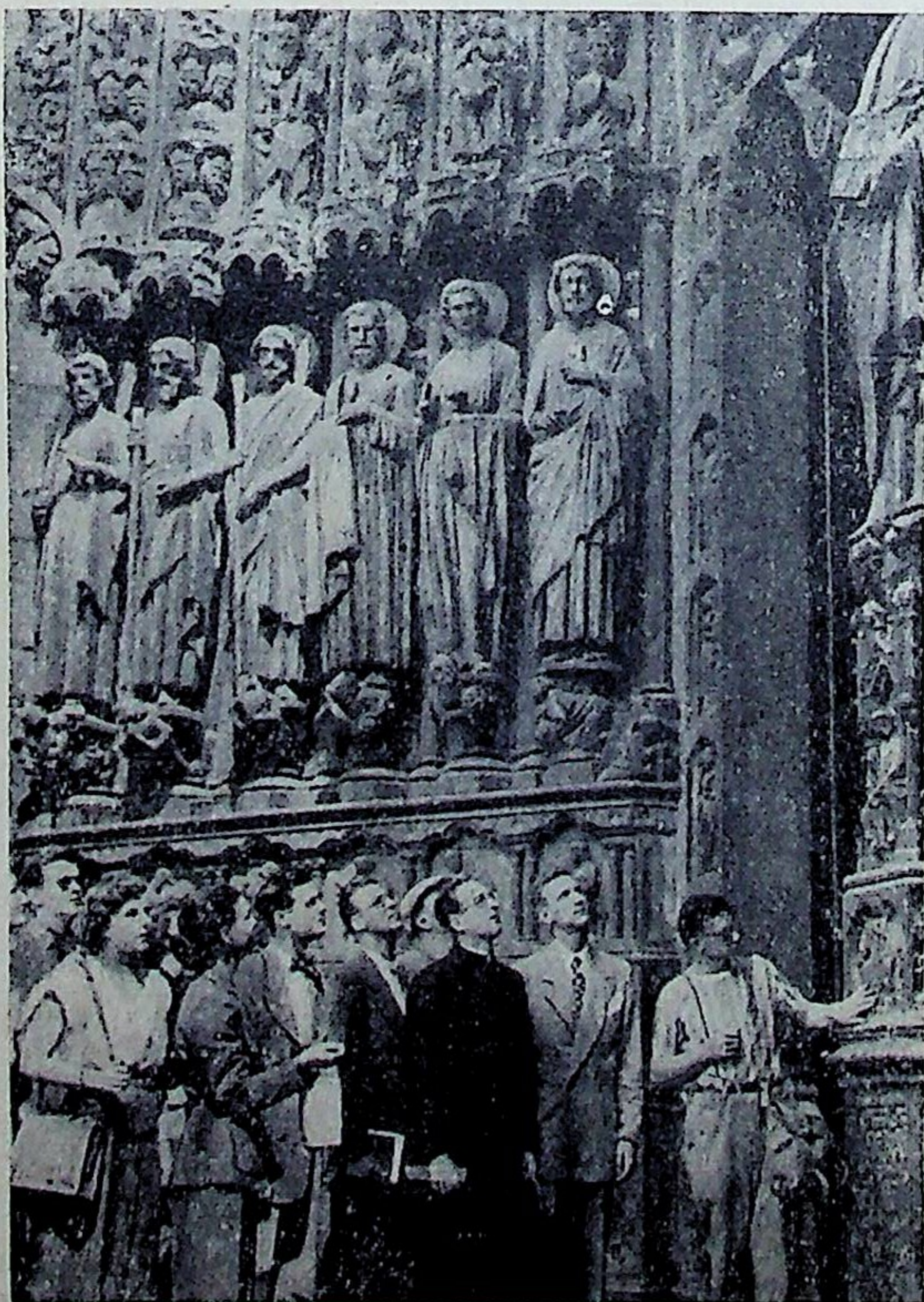
Que regardent-ils ? Découvrent-ils, à travers la beauté des pierres sculptées, la foi et l'espérance des Saints ?