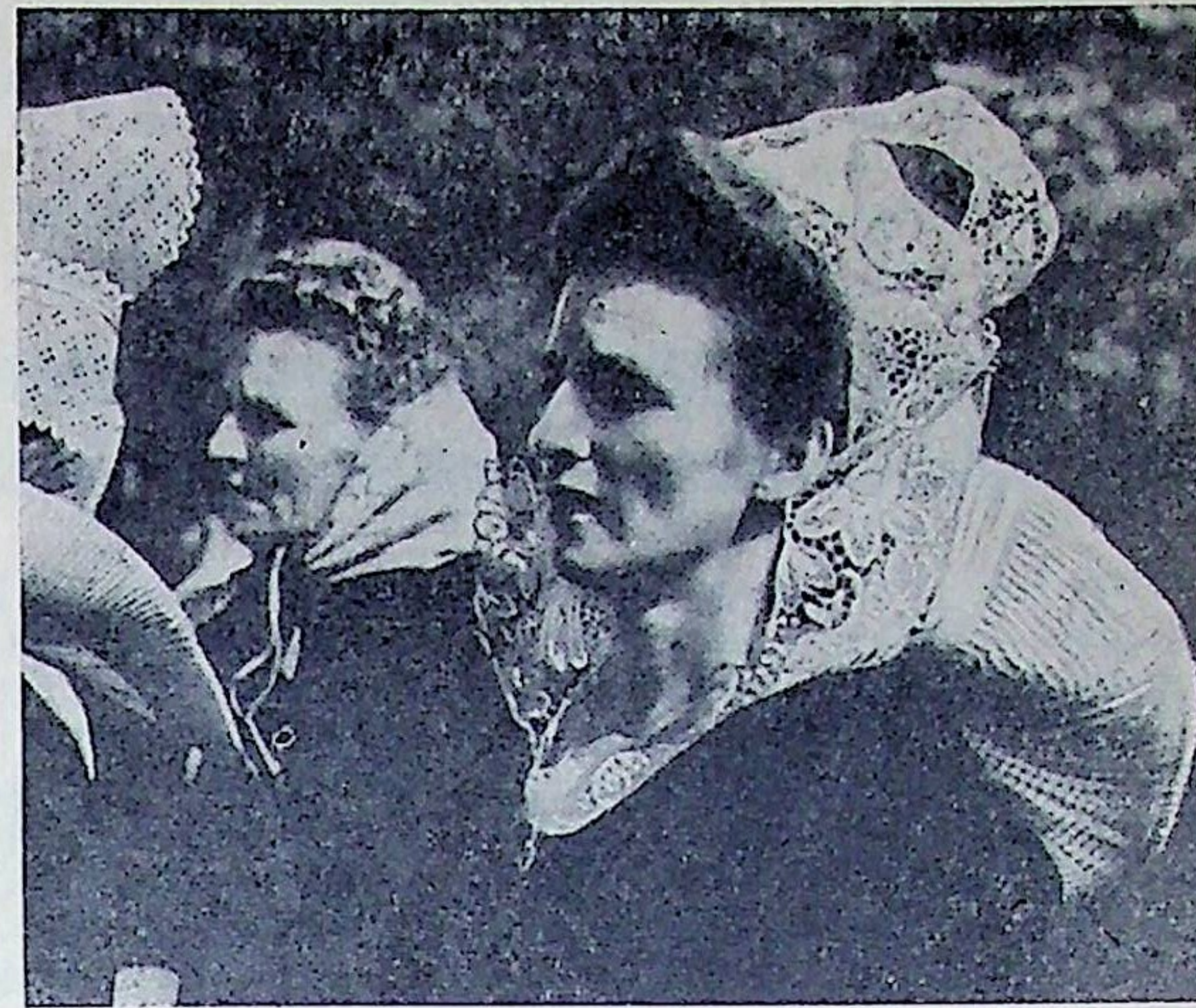
Bretonnes à Sainte-Anne-d'Auray le jour du pèlerinage.