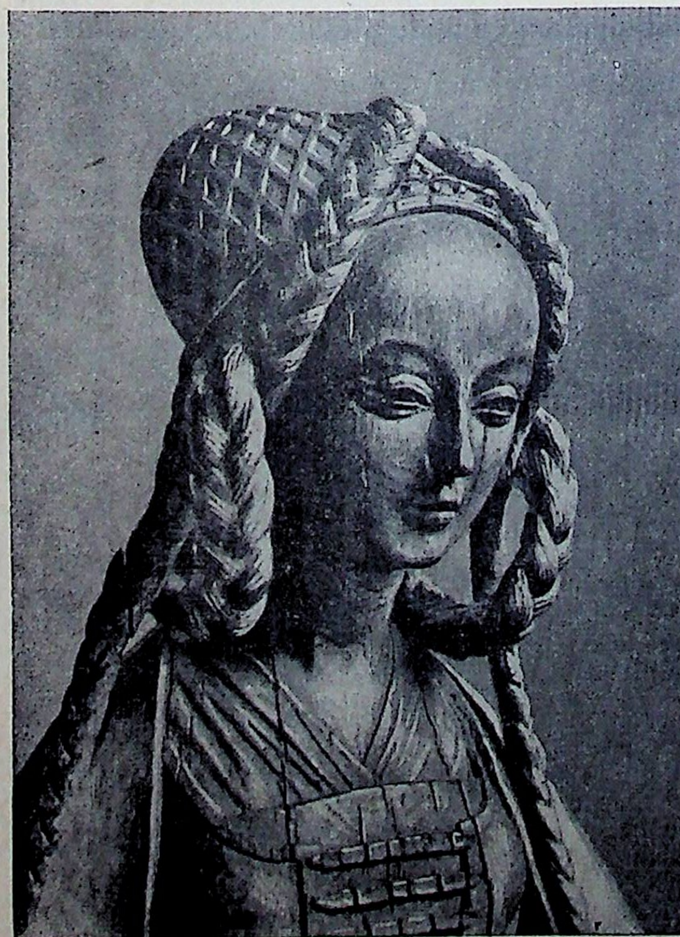
Statue en bois (xvi e siècle). Musée de Cluny, Paris.

25 MAI. — Grande journée pour les 30 garçons et les 26 filles, dont c'est la Communion solennelle et la Profession de Foi. Comme les années précédentes, ils se sont rendus en cortège depuis la Salle Sainte-Thérèse jusqu'à l'église, à peine assez grande pour contenir la foule des enfants et leurs familles.