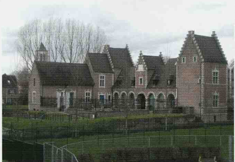
Le château de Fiers : l'un des témoignages du Villeneuve d'Ascq d'avant la nouvelle ville.