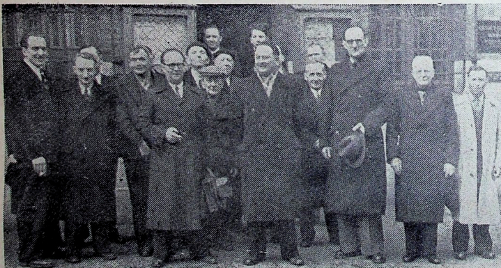
La réunion est terminée et les mutualistes quittent la mairie où ils viennent de tenir leur assemblée générale.