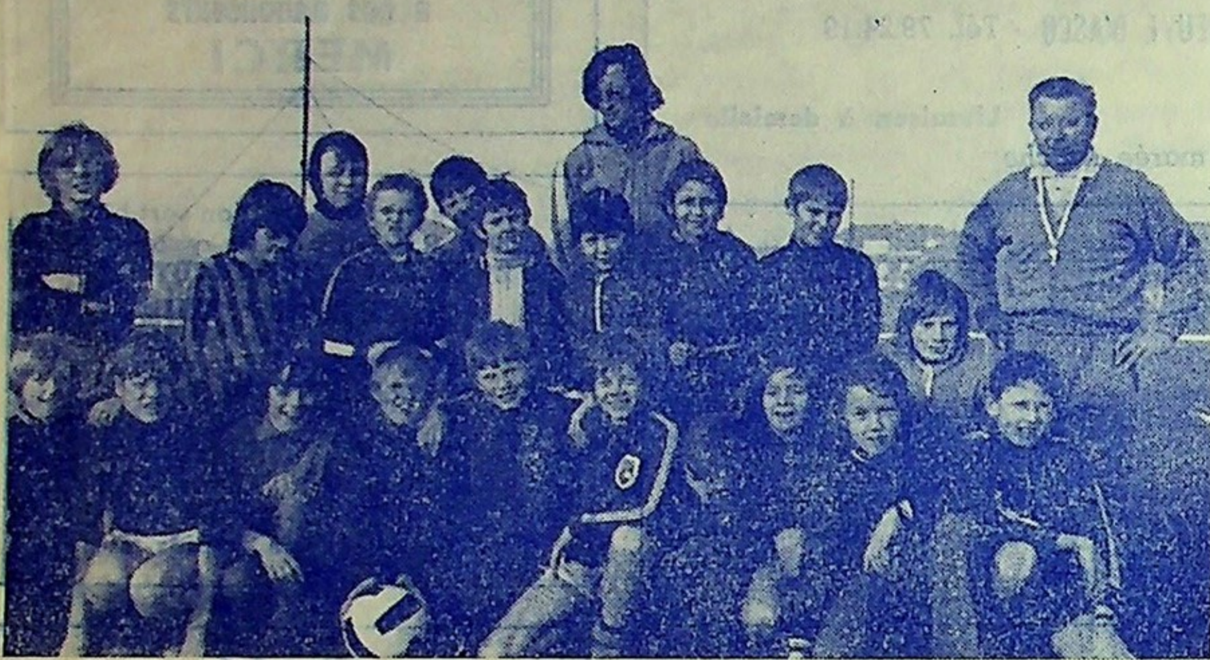
Debouts de gauche à droite :